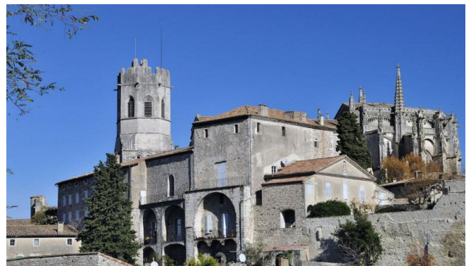
Conférence : Les quartiers des cathédrales