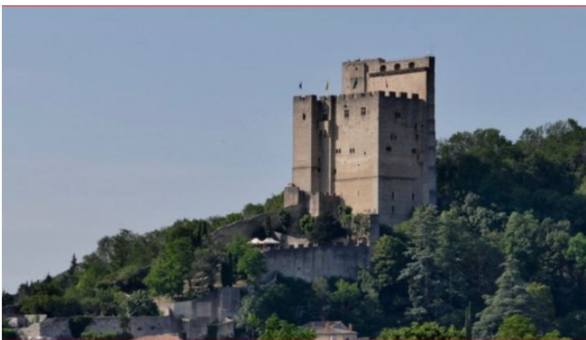
Visite : Crest, deux univers

Programme complet, adhésion et inscription sur notre nouveau site